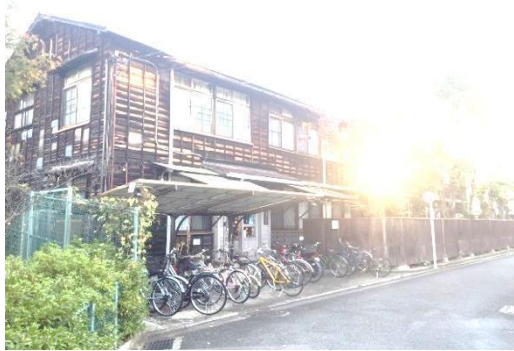
観(朝日をあびながら)